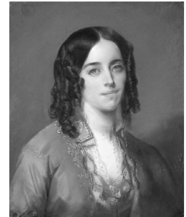
George Sand. Pastell von Charles Louis Grata, um 1835

Haar der Kreolin Indiana, denkt sie) korrespondiert exakt mit dem ebenso schwarzen Rüschenkleid, das einen tiefen Ausschnitt hat und einen Blick auf ihr makellostes Dekolleté freigibt. Ihr Gesicht hat einen eher dunklen Teint. Sie verzichtet – anders als die Damen ihrer Zeit – auf Puder. Unter den edel gewölbten Brauen blicken ihr braune, stets wie von Melancholie oder Trauer umflorte Augen entgegen. Sie beschließt, das doch etwas zu strenge Äußere mit ein paar Accessoires aufzulockern: Sie steckt sich eine weiße Blüte ins Haar, legt ein silbernes Kreuzifix um den Hals, das zwischen den schwarzen, durchbrochenen Rüschen des Ausschnitts umso mehr zu glitzern scheint (mögen sie doch vom »Teufel aus Berry« denken, was sie wollen, schmunzelt sie), und hängt einen kleinen, in einer Scheide verwahrten Dolch, dessen Knauf mit Halbedelsteinen besetzt ist, an den Gürtel. Auch dies mehr ein Accessoire, das mit Projektionspiel spielt, denn eine Waffe, die geeignet wäre, sich nachts in den Gassen der Pariser Altstadt nötigenfalls zur Wehr zu setzen.